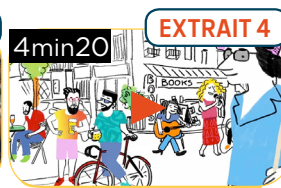
LE MOT « BOBO », UN NÉOLOGISME FRANÇAIS