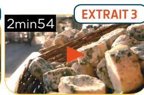
LE MARCHÉ DE LA CROIX-ROUSSE À LYON