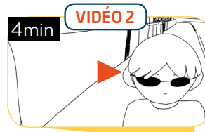
SAMUEL - LES VACANCES - ÉPISODE 11/21