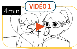
SAMUEL - LA GRANDE JULIE - ÉPISODE 1/21