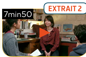
LES DROITS DU LECTEUR - « TU N'AS PAS LE DROIT DE DONNER UN LIVRE QUE TU AIMES »