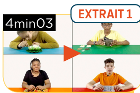
SE PRÉSENTER ET PARLER DE SES ORIGINES FAMILIALES