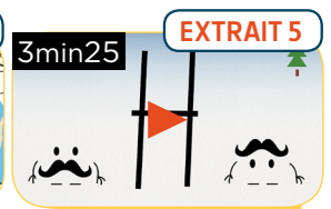
LA LETTRE : LE « H »