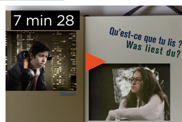
QU'EST-CE QUE TU LIS ? LE JOURNAL D'ANNE FRANCK