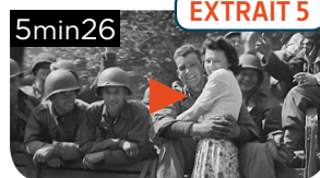
LA PRISE DE LA NORMANDIE PAR LES ALLIÉS