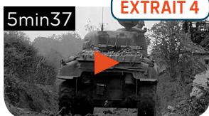
LA DIFFICILE AVANCÉE DES TROUPES ALLIÉES APRÈS LE DÉBARQUEMENT EN NORMANDIE