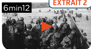
LE « D DAY » SUR LES CÔTES NORMANDES