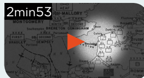
OPÉRATION « FORTITUDE » : L'INTOX DES ALLIÉS POUR GAGNER LA GUERRE