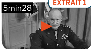
PRÉPARATION DU DÉBARQUEMENT EN NORMANDIE