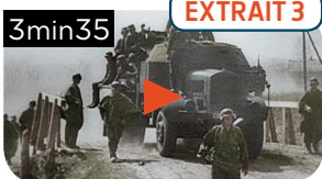
LA DIVISION « DAS REICH » EN ROUTE VERS LA NORMANDIE