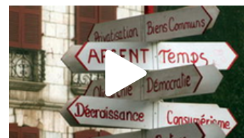
REPENSER L'ORGANISATION DES SOCIÉTÉS