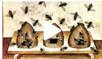
LES ATTEINTES À LA FAUNE ET LA FLORE