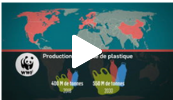
LES ACTIVITÉS HUMAINES QUI FONT PRESSION SUR LA BIODIVERSITÉ