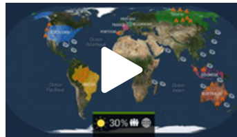
EN MESURER LES CONSÉQUENCES