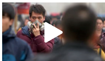
LES OBSTACLES AU CHANGEMENT