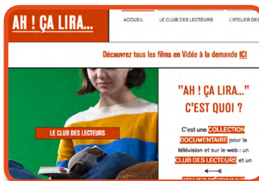
Site de la série Ah ! ça lira...