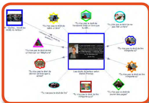
Carte mentale : Les 10 droits imprescriptibles du lecteur - Comme un roman, Daniel Pennac