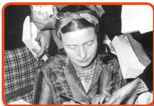
Thématique Educ'ARTE « Portraits d'écrivains »