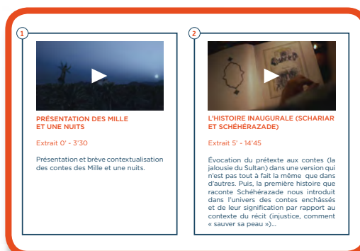
Fiche pédagogique pour explorer une œuvre foisonnante : Les mille et une nuits