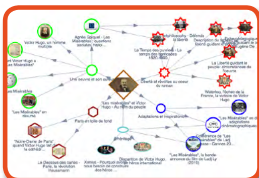
Exemple de carte mentale à décliner sur une autre œuvre